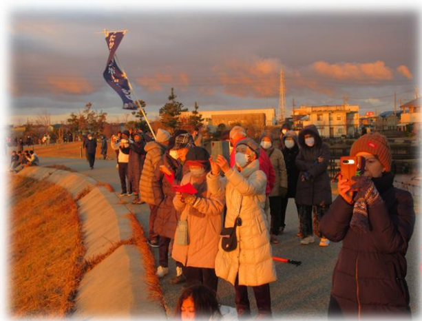
初日の出を待つ参加者