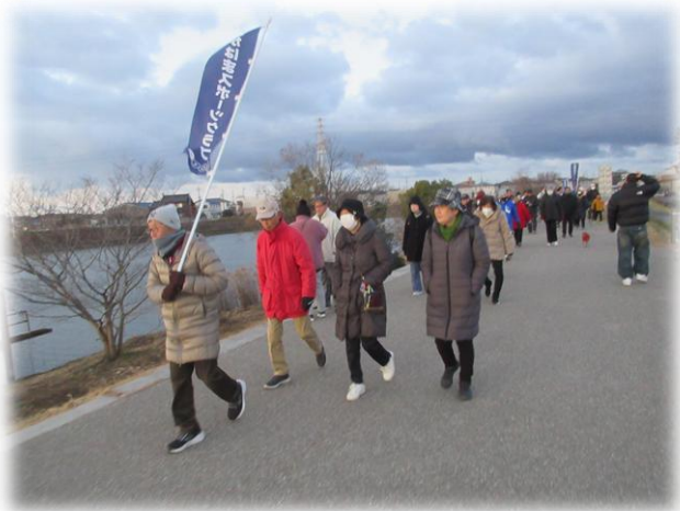
油ヶ淵に向かう参加者